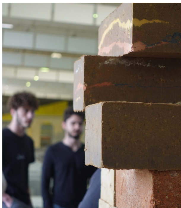
Formation DREAL