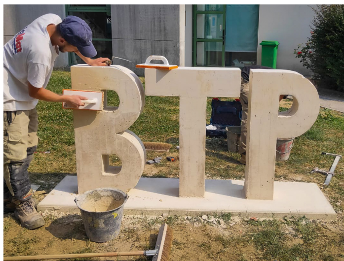
Projet pédagogique «Agir pour construire»